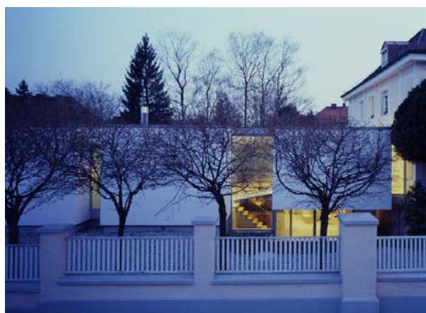
vue depuis le jardin.