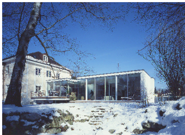
vue depuis la rue.